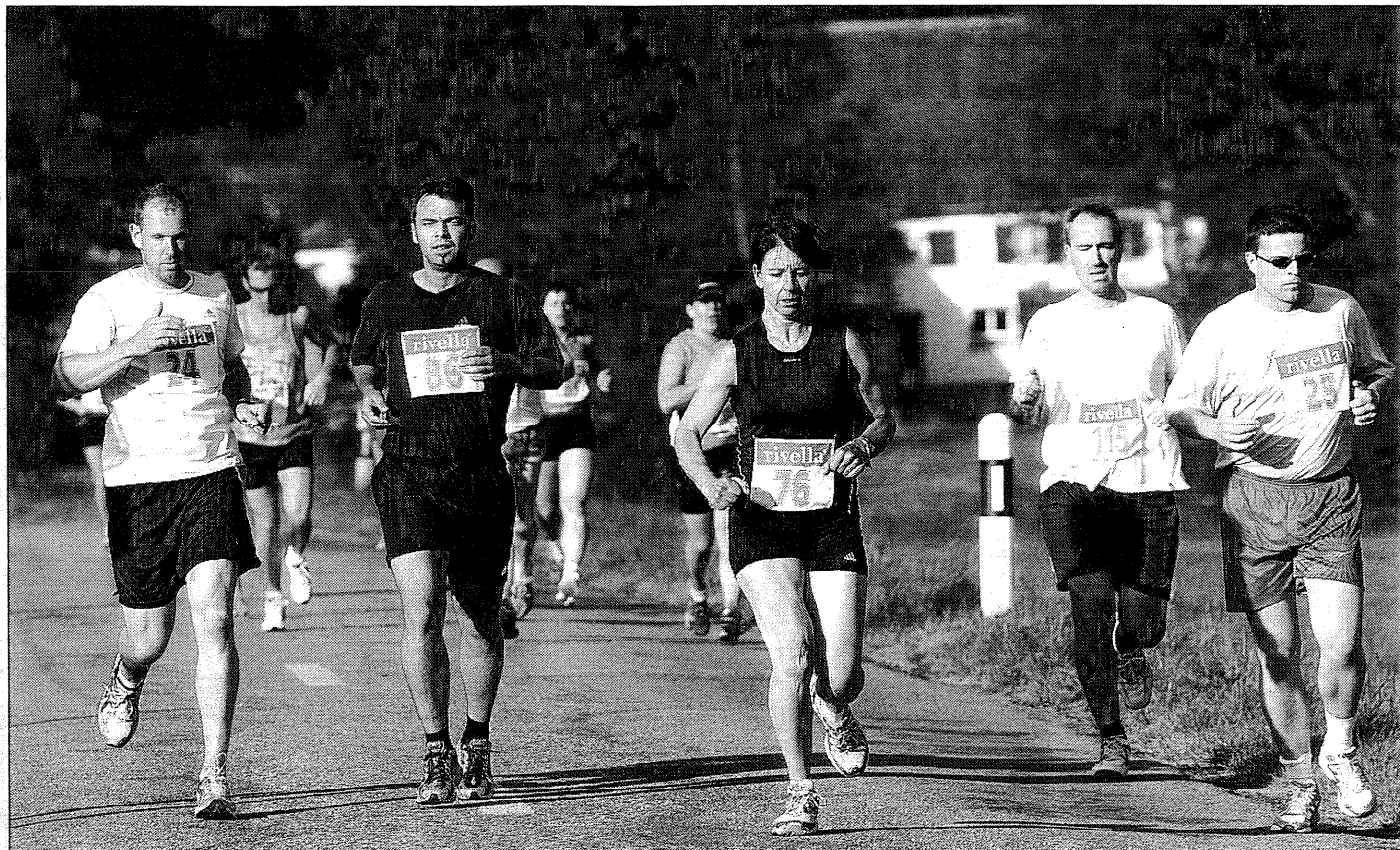
Une bonne participation dans toutes les catégories, d'excellents chronos, un temps radieux: le 33 e Tour du Val Terbi a été un grand succès hier soir.