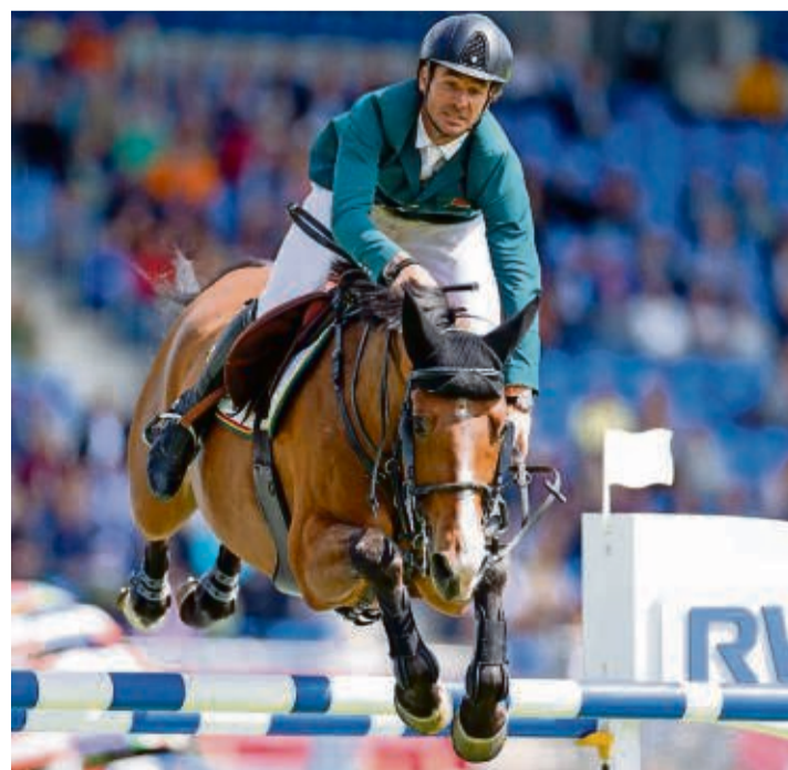
Steve Guerdat et Albfuehren's Maddox ont pris la deuxième place en Allemagne.