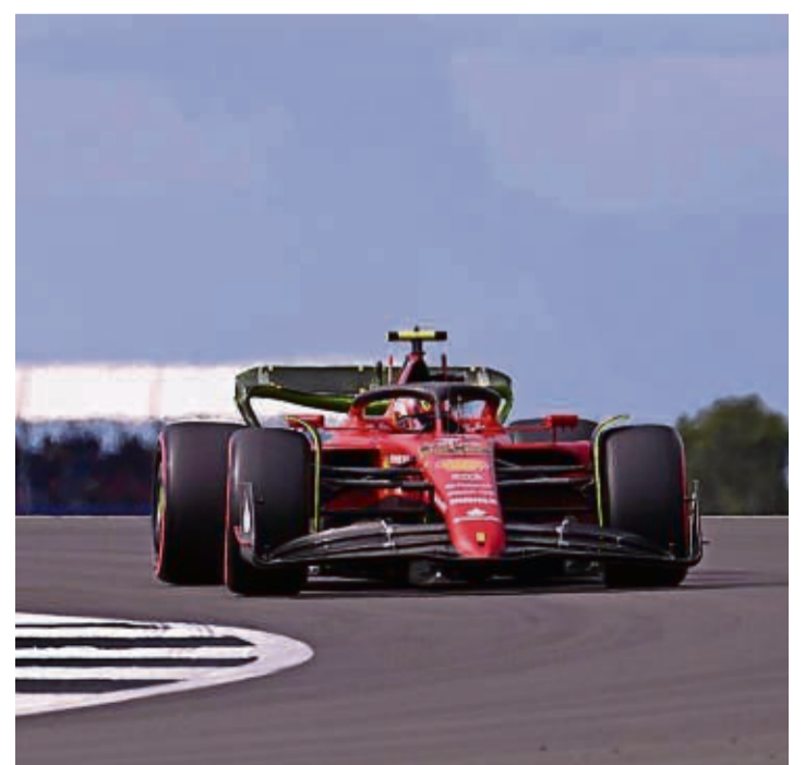
Le pilote espagnol de chez Ferrari Carlos Sainz a été le plus rapide hier lors des essais libres à Silverstone.

Silverstone (ENG). Grand Prix de Grande-Bretagne. Essais libres. 1. Sainz 1'28''942 (238,443 km/h). 2. Hamilton à 0''163. 3. Lando Norris (GBR), McLaren-Mercedes, à 0''176. 4. Max Verstappen (NED), Red Bull-Honda, à 0''207. 5. Leclerc à 0''462. 6. Fernando Alonso (ESP), Alpine-Renault, à 0''753. 7. Sergio Perez (MEX), Red Bull-Honda, à 0''811. 8. George Russell (GBR), Mercedes, à 0''857. 9. Daniel Ricciardo (AUS), McLaren-Mercedes, à 0''960. 10. Stroll à 1''000. 11. Bottas à 1''058. Puis: 15. Zhou à 1''329. 20 pilotes en lice.